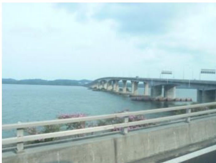
Fot. 3. Most Tuas Second Link nad cieśniną Johor, łączący Singapur z Malezją, fot. autor

Z Malezją wyspa Singapur jest połączona za pomocą nasypu (grobli) ( The Causeway ), którym biegnie droga, linia kolejowa i rurociąg, łączącego północną część wyspy z malezyjskim miastem Johor Baharu oraz w zachodniej części nowym mostem Tuas Second Link , wykorzystywanym głównie przez ciężarówki oraz bardzo liczne dalekobieżne autobusy, kursujące do miast zachodniej Malezji i Tajlandii (fot. 3, ryc. 1).