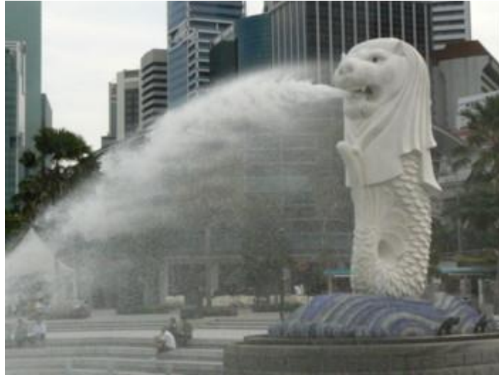
Fot. 2. Merlion , ryba z głową lwa, symbol Singapuru

Nazwa Singapur, pojawiła się w XIII w. i związana jest z legendą, według której sułtan Palembangu zobaczył na wyspie lwa lub – według innej wersji – rybę z głową lwa. Pochodzi od dwóch sanskryckich słów: singa (lew) i pura (miasto), stąd w odniesieniu do Singapuru stosuje się także nazwę Miasto Lwa, a symbolem miasta jest Merlion , ryba z głową lwa (fot. 2.).