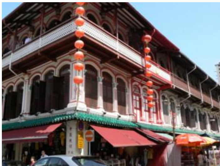
Fot. 5. Pagoda Street w Chinatown