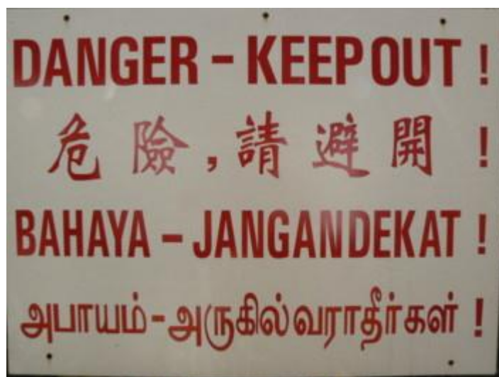
Fot. 7. Przykład czterech języków urzędowych Singapuru

nadal rósł i niebawem stanie się on swoistym „ lingua franca ” mieszkańców Singapuru. Już dziś porozumiewanie się w języku angielskim nie nastęca żadnych problemów.