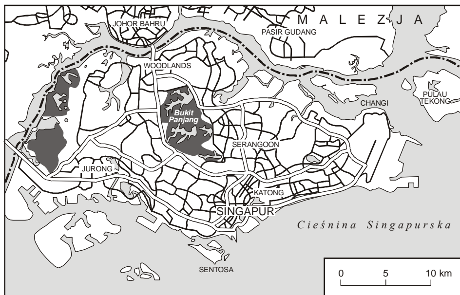
Ryc. 1. Singapur

Singapur jest państwem wyspiarskim. Największa wyspa ma powierzchnię 581 km 2 , co stanowi aż 84% całkowitej powierzchni kraju. Jej maksymalna szerokość to zaledwie 23 km, a długość 42 km. Ponadto do Singapuru należą 63 niewielkie wyspy, zarówno naturalne, jak i sztuczne, spośród których ok. 1/3 jest bezludna. Najistotniejsze wśród tych wysp to Jurong Island, Pulau Tekong, Pulau Ubin i Sentosa (ryc. 1). W ciągu ostatnich 40 lat, w wyniku zasypywania płycizn i przybrzeżnych raf oraz tworzenia sztucznych wysp, powierzchnia państwa zwiększyła się o kilkadziesiąt km 2 (Hanna 2000, Sobczyński 1989, 2006).