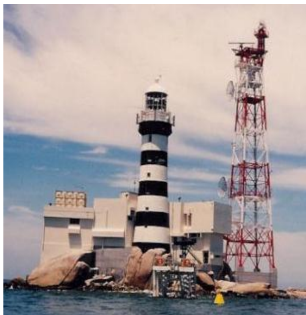
Fot. 4. Infrastruktura wyspy Pedra Branca