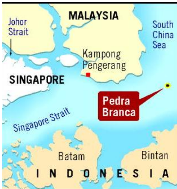
Ryc. 3. Lokalizacja wyspy Pedra Branca

Specyficznym rodzajem zagrożenia, aczkolwiek istotnym z uwagi na rolę transportu morskiego w gospodarce Singapuru, jest piractwo morskie prowadzone na wodach malajskich i indonezyjskich.