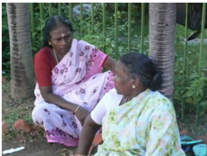
Fot. 6. Hinduski w Little India

Struktura językowa jest pochodną przeszłości kolonialnej oraz bardzo zróżnicowanego składu etnicznego mieszkańców. W Singapurze są aż cztery języki urzędowe: angielski, chiński, malajski, tamilski, z tym że język malajski ma status „języka narodowego”. Natomiast współczesna struktura językowa mieszkańców kształtuje się następująco: 58,8% chiński (poszczególne dialekty: 35% mandaryński, 11,4% hokkien, 5,7% kantoński 4,9% teochew, 1,8% inne dialekty chińskie), 23% angielski, 14,1% malajski, 3,2% tamilski, 0,9% inne 14 . Tak duże zróżnicowanie językowe, powodowało istotne problemy w porozumiewaniu się. Jednak z powodu wyraźnego preferowania angielskiego na wszystkich szczeblach singapurskiego szkolnictwa, można przypuszczać, że udział tego języka będzie w przyszłości