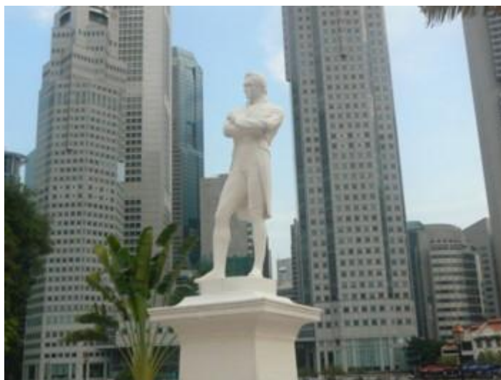
Fot. 1. Założyciel Singapuru, sir Stamford Raffles na tle dzielnicy biznesowej

W 1965 r., pierwszy raz w historii, praktycznie wbrew swej woli, Singapur otrzymał możliwość funkcjonowania jako niepodległe państwo i tą możliwość doskonale wykorzystał. Pomimo bardzo małego terytorium, braku bogactw naturalnych, kolonialnej gospodarki, zróżnicowanego społeczeństwa, szybko stał się błyskawicznie rozwijającym się, zamożnym państwem o bardzo stabilnym systemie politycznym. Stał się fenomenem na skalę światową.