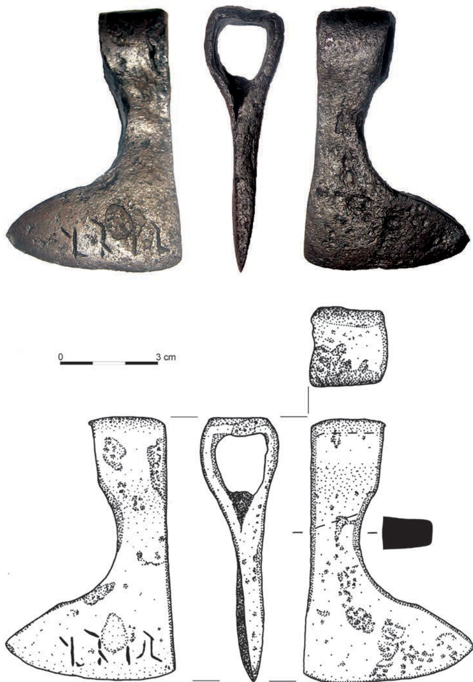
Ryc. 1. Toperek z Ostrowa Tumskiego w Poznaniu (fot. i rys. P.N. Kotowicz; przerys. A. Sabat)