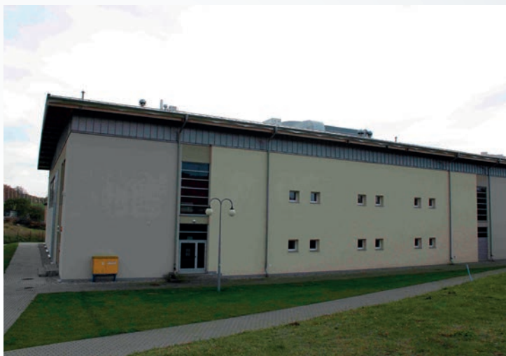
Fot. 6. Hala widowiskowo-sportowa w Gniewinie (aut. M. Wójcik)

Trudno rzutować własne odczucia na wszystkich odwiedzających Gniewino. Jednakże wydaje się, że największe wrażenie wywiera, szczególnie podczas pierwszej wizyty, Centrum Sportowe. Sukces miejsca był efektem zgłoszenia Gniewina w kwietniu 2007 roku do Ministerstwa Sportu i Turystyki jako kandydata na centrum pobytowe Euro