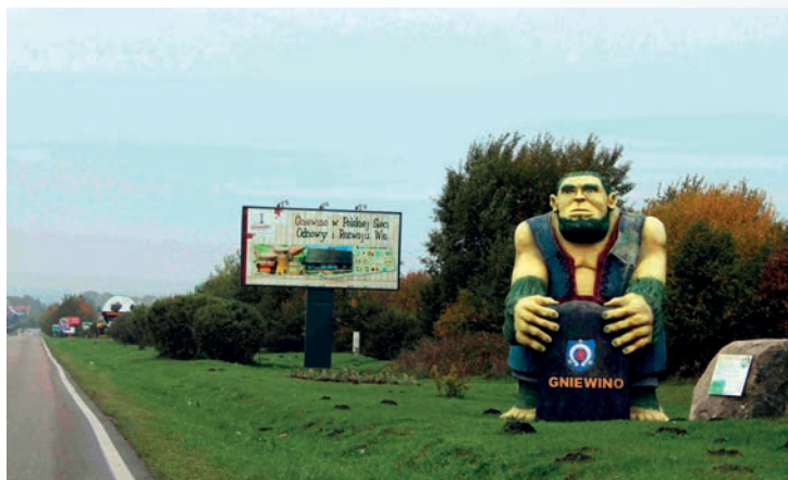
Fot. 3. Figura Stolema przy wjeździe do Gniewina (aut. M. Wójcik)

Wizytę w Gniewinie warto rozpocząć od dotknięcia tego, co tradycyjne, a więc od historycznej tkanki centrum wsi. Główna droga do tej części miejscowości mija teren dawnego Państwowego Gospodarstwa Rolnego. Upadek dawnego PGR uznaje się za przykład jednej z wspomnianych, historycznych trudności przekutych przez mieszkańców Gniewina w sukces ich wsi. Dzisiaj teren dawnego PGR jest zindustrializowanym