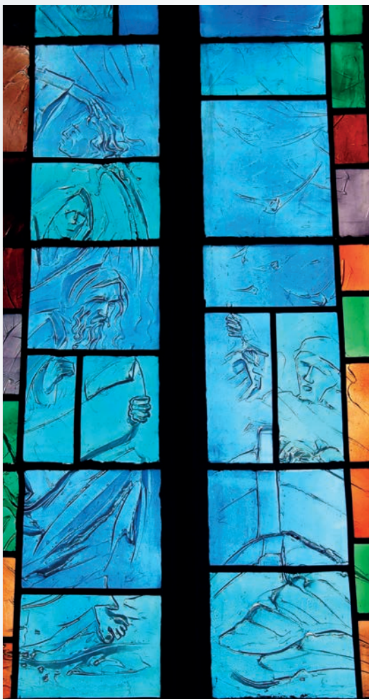
Fot. 4. Nowoczesne witraże w kościele p.w. św. Józefa Rzemieślnika autorstwa Jarosława Wójcika