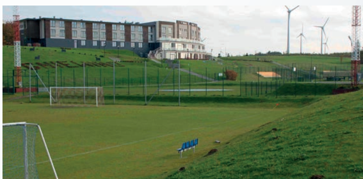
Fot. 8. Hotel „Mistral Sport”