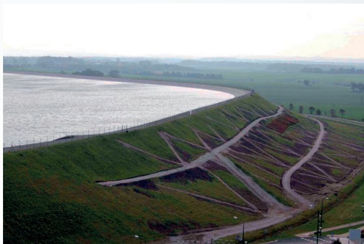
Fot. 2. Widok z wieży widokowej „Kaszubskie Oko” na sztuczny zbiornik Kolkowo (aut. M. Wójcik)

mie figury są nie lada atrakcją dla najmłodszych, choć intrygują też starszych. Wykorzystywane są dzisiaj jako jeden z symboli wsi. Są jednocześnie dowodem na umiejętne budowanie współczesnej opowieści o Gniewinie, o Kaszubach z odniesieniem do treści zachowanych wyłącznie w lokalnych podaniach i legendach. Są potwierdzeniem, że mityczni bohaterowie lokalnych opowiadań mogą znakomicie spełnić się w pracy nad budowaniem atrakcyjności turystycznej miejsca.