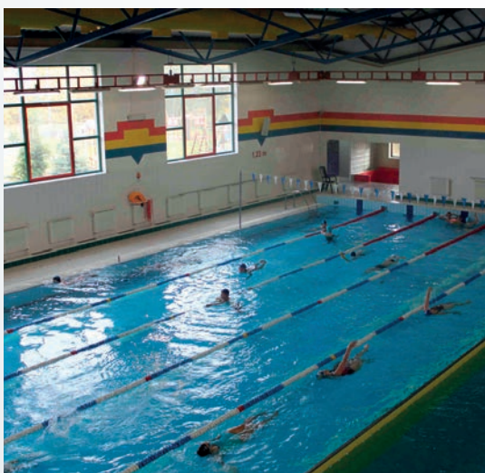
Fot. 5. Kryta pływalnia w Gnieźnie

lejn, znakomity przykład tego, co w Gnieźnie zachwyca najbardziej: umiejętnego wykorzystania elementów tradycji w budowaniu nowoczesności.