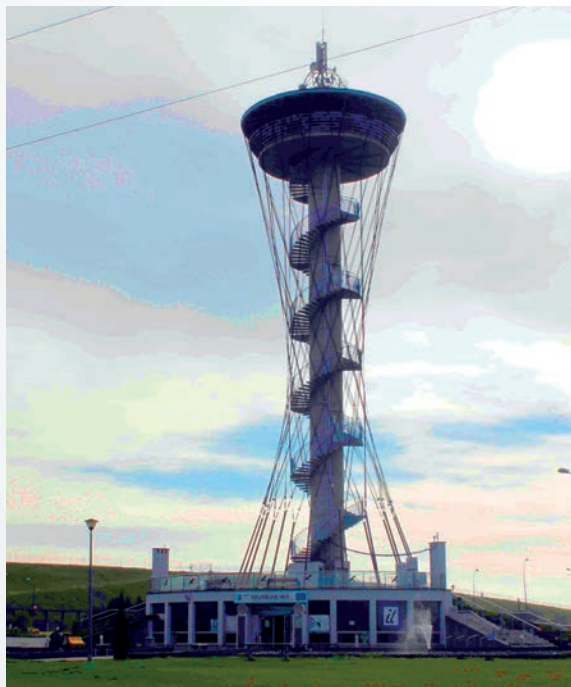
Fot. 1. Wieża widokowa „Kaszubskie Oko”

Nakreślony obraz wszystkich przezwycięzonych trudności stanowiących paradoksalnie o sukcesie Gniewina jest dowodem nieprawdopodobnej energii tkwiącej w opisywanym miejscu i w mieszkańcach wsi. Świadomość podjętych z powodzeniem wyzwań sprawia, że spacer po Gniewinie nabiera zupełnie innego wymiaru. Choć i bez tej świadomości wizyta w Gniewinie dostarcza niezapomnianych i niespodziewanych (szczególnie przy pierwszych odwiedzinach) wrażeń. Pora zatem wyruszyć na spacer po Gniewinie – pulsującym energią tkwiącą zarówno w ludziach, jak i infrastrukturze, pełnym energii Kaszub.