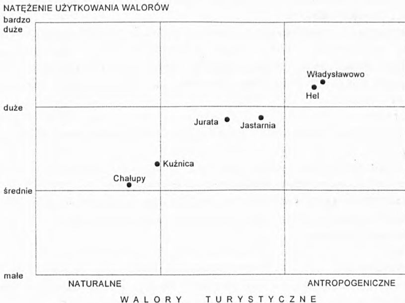
Rys. 2. Spodziewane kierunki rozwoju miejscowości Półwyspu Helskiego

Uwzględniając powyższe założenia przyjęto hipotetyczny kierunek rozwoju miejscowości Półwyspu Helskiego (rys. 2). Według tego wykresu Chałupy i Kuźnica winne rozwijać takie oferty turystyczne, które będą bazowały głównie na walorach środowiska przyrodniczego, wykorzystywanych w stopniu średnim. Dość niski stopień wykorzystania walorów wynika przede wszystkim z wyjątkowo dużej wrażliwości tego odcinka półwyspu na jakiegokolwiek użytkowanie gospodarcze.