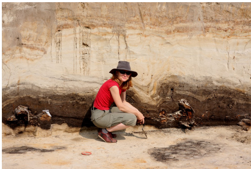
Fot. 3. Struktury niestatecznego warstwowania gęstościowego jako świadectwo środowiska peryglacjalnego (fot. P. Kittel, 2011)

Obszar basenu uniejowskiego podczas zlodowacenia wisły (vistulianu), tzn. ostatniego zimnego piętra stratygraficznego czwartorzędu, około 115 000–10 000 lat BP, znajdował się poza zasięgiem lądolodu, w tak zwanej strefie ekstraglacialnej. Panowanie zimnych, peryglacjalnych warunków klimatycznych wyznaczało kierunek rozwoju rzeźby terenu i determinowało intensywne i wydajne morfogenetycznie procesy. Badania tych procesów stanowiły bardzo ważny kierunek badawczy łódzkich geografów od początku istnienia ośrodka. W skrajnych przypadkach, w czasie apogeum zimna – przy maksymalnym rozwoju lądolodu w okresie vistulianu, co miało miejsce ok. 20 000 lat BP, gdy jego czoło znajdowało się kilkanaście kilometrów na północ od basenu 12 , panowało tutaj środowisko pustyni arktycznej.