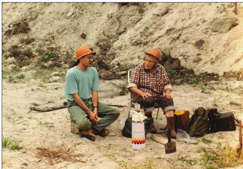
Fot. 1. Badania terenowe osadów lodowcowych w odkrywce KWB Adamów, pole Koźmin, 1995

eksploatacyjnym KWB Adamów „Adamów-Smulsko” (fot. 1). Zlokalizowane ono było na wysoczyźnie morenowej, nieco poza granicami basenu, niemniej jednak, jak należało się spodziewać, i co zostało potwierdzone w trakcie późniejszych badań, osady te wyścielają również analizowany obszar. Rekonstrukcja paleogeograficzna oparta była na wielokierunkowej identyfikacji osadów 5 .