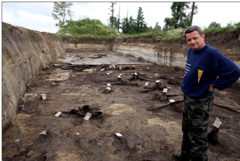
Fot. 4. Kopalny las sprzed ok. 12 000 lat odkryty w zachodniej części doliny Warty w miejscowości Koźmin

globalnego ocieplenia wywołanego wzmożoną emisją dwutlenku węgla na skutek działalności człowieka. Należy nadmienić, że stanowisko z kopalnymi pniami jest unikatowe w skali europejskiej, dlatego prowadzone prace są finansowane ze środków Narodowego Centrum Nauki (grant badawczy N N306 788 240 pt. „Warunki paleogeograficzne funkcjonowania i destrukcji późnowistuliańskiego lasu w dolinie Warty”) w Katedrze Badań Czwartorzędu UŁ we współpracy ze specjalistami z AGH w Krakowie, Wydziału Leśnego SGGW w Warszawie, Instytutu Botaniki PAN w Krakowie oraz Instytutu Geologii UAM.