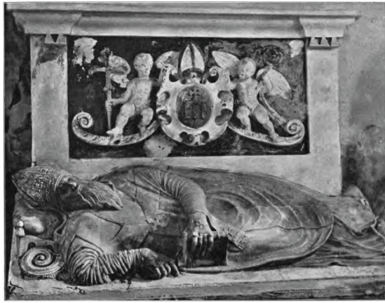
Fotografia 5. Nagrobek arcybiskupa J. Uchańskiego w kolegiacie łowickiej