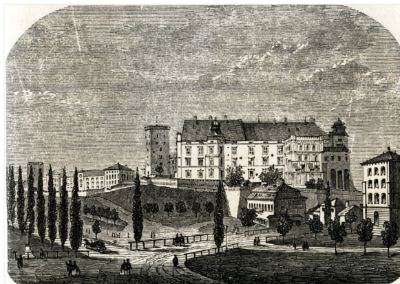
Fotografia 3. Widok Zamku Królewskiego na Wawelu od strony wschodniej, drzeworyt