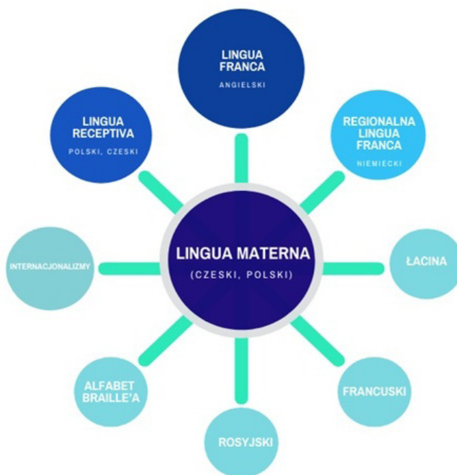
Diagram 1. Obecność języków na publicznych tablicach informacyjnych polsko-czeskiego pogranicza

na napisach wyrytych na kamiennych murach. O wciąż żywych kontaktach świadczyć może jednak fakt ujmowania niemieczyzny w wielu konfiguracjach na współczesnych tablicach informacyjnych. Świadectwem historii i dawnej hierarchii językowej jest umieszczanie na murach kościołów i innych zabytkowych budowli napisów po łacinie. Z rzadka można też zaobserwować obecność innych języków, tzw. kongresowych: francuskiego czy rosyjskiego. Zdarzają się też tablice zawierające przekaz międzynarodowy, na przykład: Aquapark Wodny Świat .