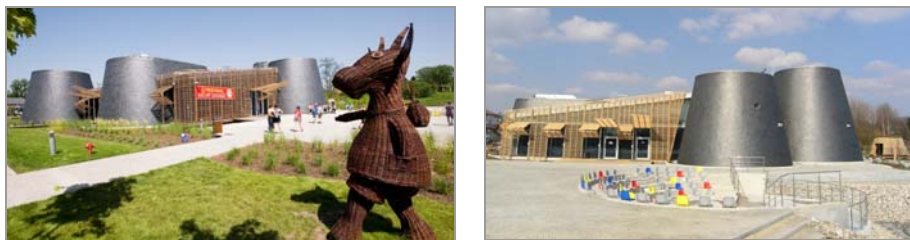
Fotografia 1. Europejskie Centrum Bajki im. Koziołka Matołka w Pacanowie

nowie i uzyskał zgodę na pozyskiwanie środków na sfinansowanie inwestycji. Wniosek o dofinansowanie projektu budowlanego, którego celem było stworzenie siedziby instytucji kultury został złożony w 2005 r. w ramach Priorytetu 3 „Ochrona kulturowego dziedzictwa europejskiego” w konkursie ogłaszanym w ramach Norweskiego Mechanizmu Finansowego i Mechanizmu Finansowego Europejskiego Obszaru Gospodarczego. Przyznana dotacja wyniosła 2 669 802 euro 3 .