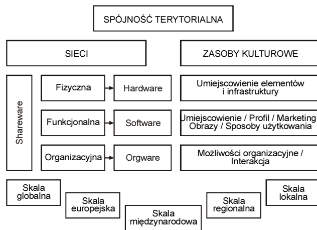
Rys. 1. Spójność terytorialna: model analityczny

Zastosowanie tego modelu na poziomie regionalnym i lokalnym pozwala ustalić potencjał oraz słabe punkty rozwoju regionalnej tożsamości kulturowej i miejscowości turystycznej. Rozwój i wzmocnienie sieci wymaga potrójnej strategii: