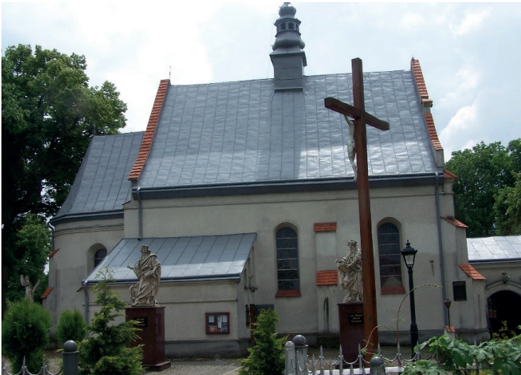
Ryc. 6. Obecny wygląd kościoła parafialnego pw. św. św. Piotra i Pawła w Grodzisku

Dzięki trosce administratorów parafii Grodzisko tamtejsza świątynia, choć często wymagająca napraw i modernizacji, przetrwała minione wieki w dobrym stanie (ryc. 6), co stanowi pokłosie intensywnych prac przeprowadzanych w drugiej połowie XIX wieku, pomimo iż kolejne wizytacje odnotowywały konieczność wykonania większych prac remontowych o różnej skali. W tym czasie – zapewne wychodząc naprzeciw potrzebom wiernych – zwiększono dotychczasową kubaturę kościoła poprzez dobudowę kruchty zachodniej, w której dziś umieszczone są ławki dla wiernych.