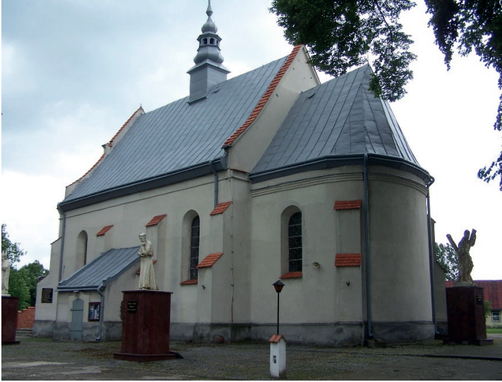
Ryc. 1. Kościół parafialny pw. św. św. Piotra i Pawła, Grodzisko