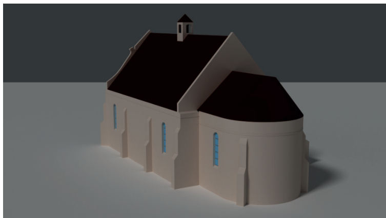
Ryc. 4. Rekonstrukcja siedemnastowiecznego wyglądu kościoła parafialnego pw. św. św. Piotra i Pawła, Grodzisko

Zaznaczyć przy tym trzeba, że współczesne formy tytułowego obiektu są wynikiem kilku renowacji oraz kilkakrotnej rozbudowy i trudno dziś jednoznacznie odtworzyć jego pierwotny wygląd. Partiami siedemnastowiecznymi kościoła są korpus, prezbiterium oraz zakrystia wzniesione i najprawdopodobniej otynkowane przed 1636 rokiem, na co wskazują informacje zawarte w przeprowadzonej w tymże roku wizytacji 13 (ryc. 4, 5).