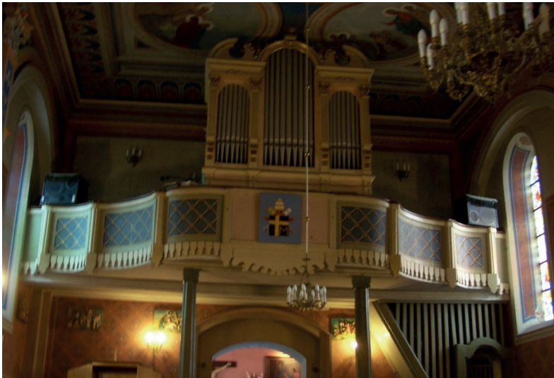
Ryc. 3. Chór, kościół parafialny pw. św. św. Piotra i Pawła, Grodzisko

We wnętrzu świątyni, w partii korpusu, płaszczyzny ścian zostały podzielone parami pilastrów umieszczonych analogicznie do usytuowanych na zewnątrz szkarp. Wieńczą je kompozytowe kapitele, na których wsparto zwielokrotniony gzyms obiegający całą nawę, ozdobiony ponad kapitelami pilastrów skromnymi kartuszami herbowymi: Paparona i Rola (na ścianie północnej), Lis i Grzymała (na ścianie południowej). Pomiedzy pilastrami umieszczono w ścianach płytkie wnęki, którym nadano formy łuków arkad. Korpus i prezbiterium przykryte zostały sklepieniami zwierciadlanymi; w zakrystii zdecydowano się na sklepienie kolebkowe. W części zachodniej korpusu znajduje się chór muzyczny o konstrukcji drewnianej wraz z organami pochodzącymi z lat 20. XX wieku 11 (ryc. 3).