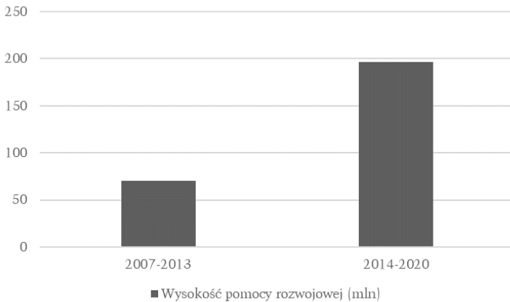
Wykres 11. Pomoc rozwojowa UE dla krajów ASEAN (w mln euro)