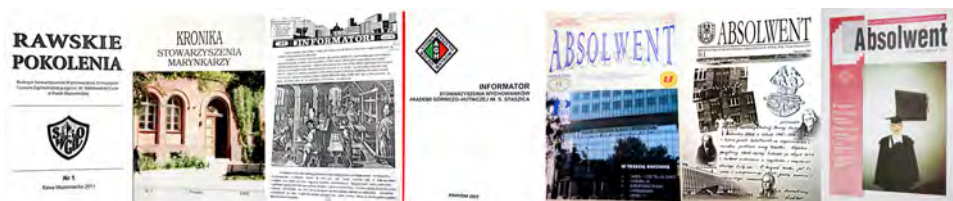
Fot. 1. Okładki czasopism absolwenczych