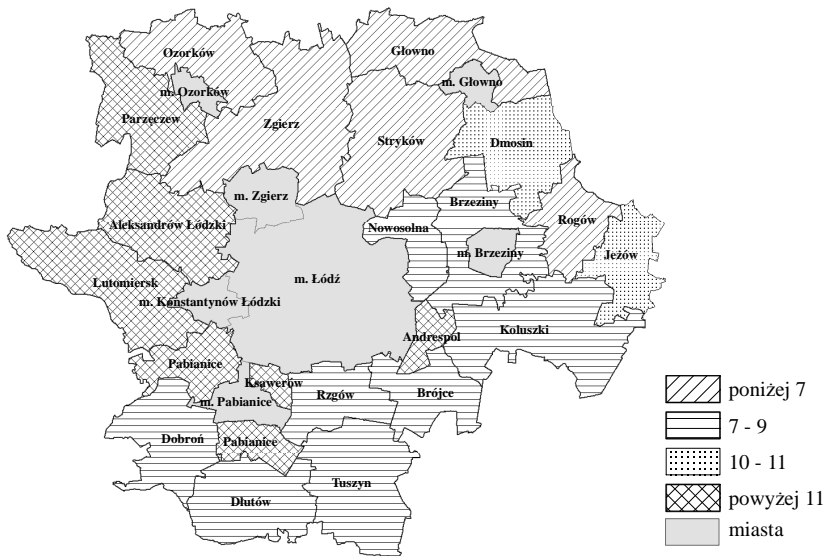
Rys. 2. Liczba dzieci szkół podstawowych przypadająca na etat nauczycielski