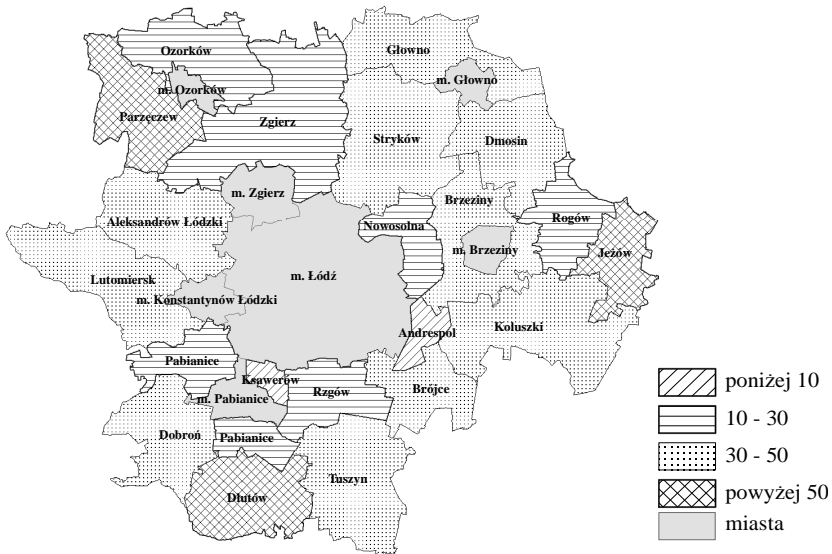
Rys. 1. Gminy ze względu na dostępność przestrzenną szkół podstawowych (km/szkolę)