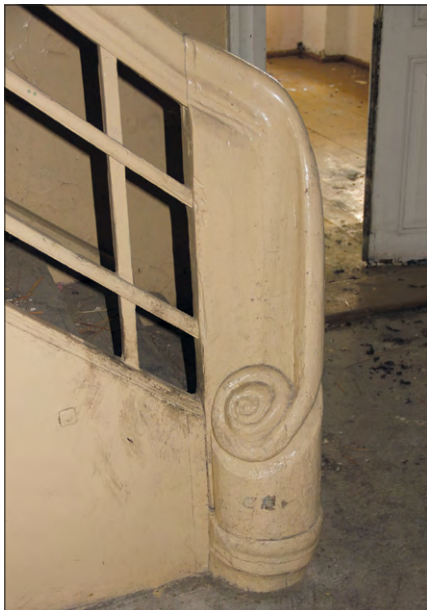
Ryc. 9. Dwór w Makowiskach – fragment balustrady schodów w sieni. Fot. ze zbiorów WUOZ w Łodzi, 2016.