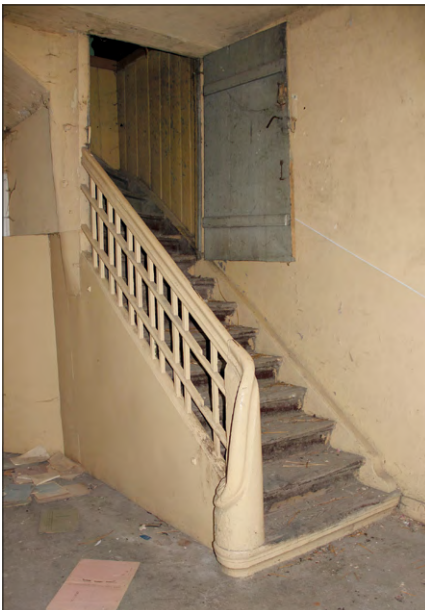
Ryc. 8. Dwór w Makowiskach – sień ze schodami w trakcie południowym. Fot. ze zbiorów WUOZ w Łodzi, 2016.