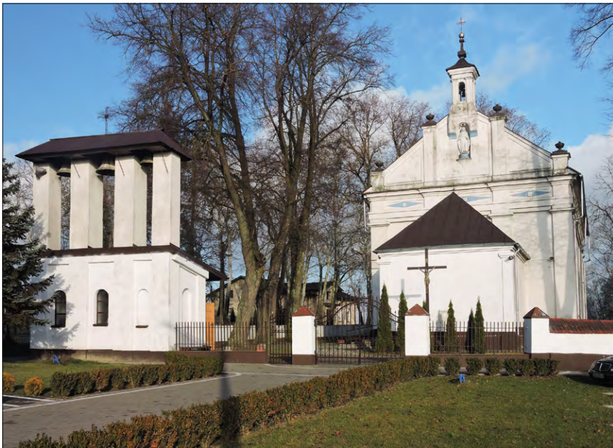
Ryc. 10. Kościół parafialny w Makowiskach od południa, po lewej dzwonnica – między nimi widoczny w głębi dwór.

Kościół i dwór to obecnie jedyni świadkowie dziejów wsi sięgających XIV w.