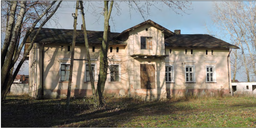
Ryc. 4. Dwór w Makowiskach – elewacja frontowa. Fot. K. Stefański, 2018.

Dawny dwór jest budynkiem zakomponowanym symetrycznie, o proporcjonalnej bryle. Tynkowane elewacje pokryte są malaturą. Część cokołowa zaakcentowana jest lekkim wysunięciem do przodu i ciemniejszym, brązowym kolorem. Malatura powyżej w kolorze jasnożółtym. Lico ściany pokryte jest delikatnymi prostokątnymi boniami. Górą pas fryzu, wyodrębniony wąskim profilowanym gzymsem, urozmaicony jest w elewacji frontowej i ogrodowej wąskimi podwójnymi okienkami strychowymi. Mocno wysunięte połacie dachu wsparte są na wysuniętych, dekoracyjnie profilowanych krokwiach. Ryzalit frontowy ujęty jest na narożach mocno zaakcentowanymi boniami.