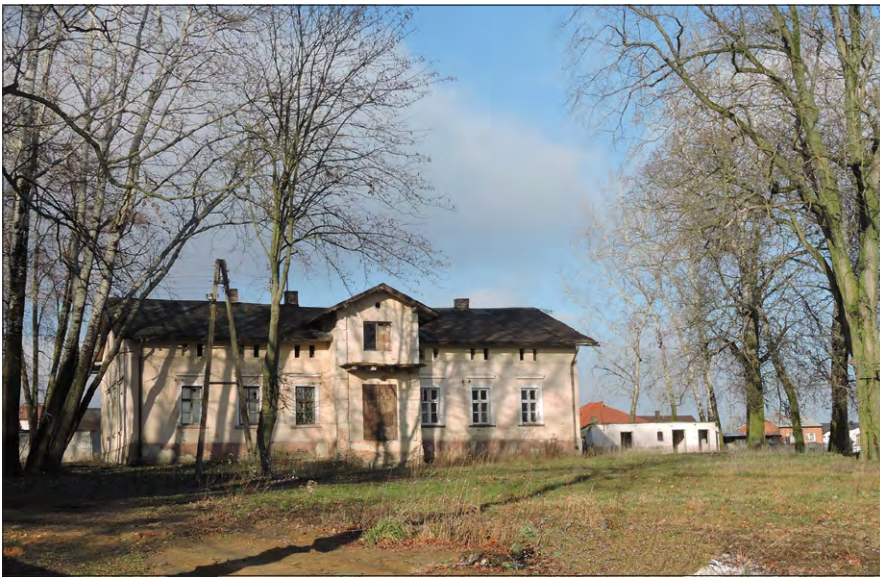
Ryc. 1. Dwór w Makowiskach, widok ogólny.

a szczególnie tzw. dwór polski, zajmuje miejsce szczególne 1 . Mimo wielkich strat, jakie przyniósł wiek XX, z dwoma niszczycielskimi wojnami i przemianami społeczno-politycznymi, na historycznych ziemiach polskich przetrwało kilka tysięcy tego typu obiektów. Znaleźć wśród nich możemy budowle o dużych wartościach artystycznych i historycznych, odnotowywane w literaturze, ale też budowle skromne, pozbawione większych walorów architektonicznych, o których historii często niewiele wiemy. Zawsze jednak dwór stanowił ważny element wiejskiego pejzażu, będąc świadectwem przeszłości i istotnym elementem kulturowego dziedzictwa danego terenu 2 . Współczesny stan zachowania tych budowli jest zróżnicowany. Obok pozytywnych przykładów renowacji i dbałości o zabytkowe budowle 3 , mamy też liczne przykłady dworów, których kondycja budzi niepokój, a dalsze trwanie niekiedy jest zagrożone. Do tego typu negatywnych przykładów należał do niedawna dwór w Makowiskach, choć wydaje się że w tym wypadku sytuacja zdecydowanie zmieniła się na lepsze.