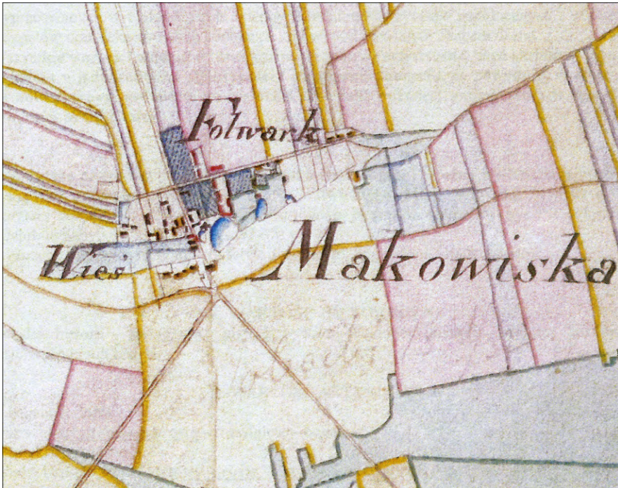
Ryc. 2. Plan wsi Makowiska z 1833 r. Archiwum Państwowe w Łodzi, Zbiór Kartograficzny, sygn. 129.

O zespole dworskim w Makowiskach brak informacji z wcześniejszych epok. Pierwsze zachowane plany miejscowości, znajdujące w zbiorach Archiwum Państwowego w Łodzi, pochodzą z 1794 r. 12 Ukazują istniejące w tym czasie duże założenie folwarczne z dworem i sąsiadującymi z nim zabudowaniami gospodarczymi skupionymi wzdłuż rozległego podwórza na planie o kształcie zbliżonym do wydłużonego prostokąta, otwartego w kierunku północnym. Dwór to budynek na planie prostokąta – nie można stwierdzić czy murowany, czy drewniany, raczej to drugie – zamykający wspomniane założenie od południa. Podobny układ możemy odczytać na planie z 1833 r. 13