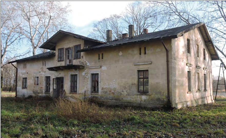
Ryc. 6. Dwór w Makowiskach – elewacja północno-zachodnia.