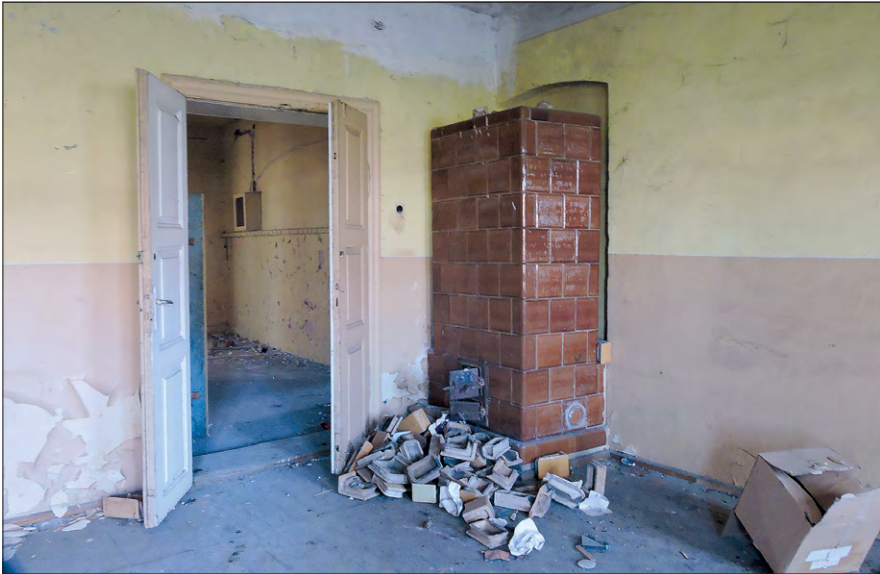
Ryc. 7. Dwór w Makowiskach – pomieszczenie środkowe w trakcie północnym.