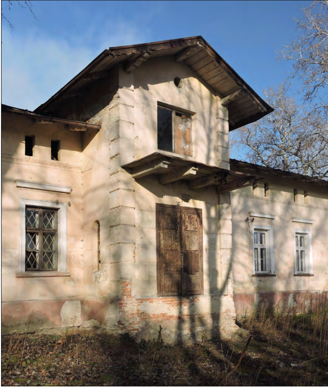
Ryc. 5. Dwór w Makowiskach – ryzalit elewacji frontowej.