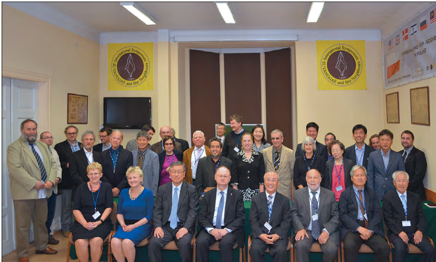
Ryc. 2. Uczestnicy XIX konferencji z cyklu „Suyanggae and Her Neighbours” w Instytucie Archeologii Uniwersytetu Łódzkiego.

W pierwszej części konferencji wygłoszonych zostało 16 referatów. W zdecydowanej większości dotyczyły one problematyki paleolitu na terenie Eurazji. Część referatów poświęcona była wynikom badań terenowych na stanowisku Suyanggae (Lee, Kong 2006), wiele uwagi poświęcono też zagadnieniom związanym z przejściem od paleolitu środkowego do górnego na terenie Półwyspu Koreańskiego (Lee 2006) oraz wykorzystaniu na terenie Syberii techniki micro-wiórowej (Drozdov, Artemyev 2006).