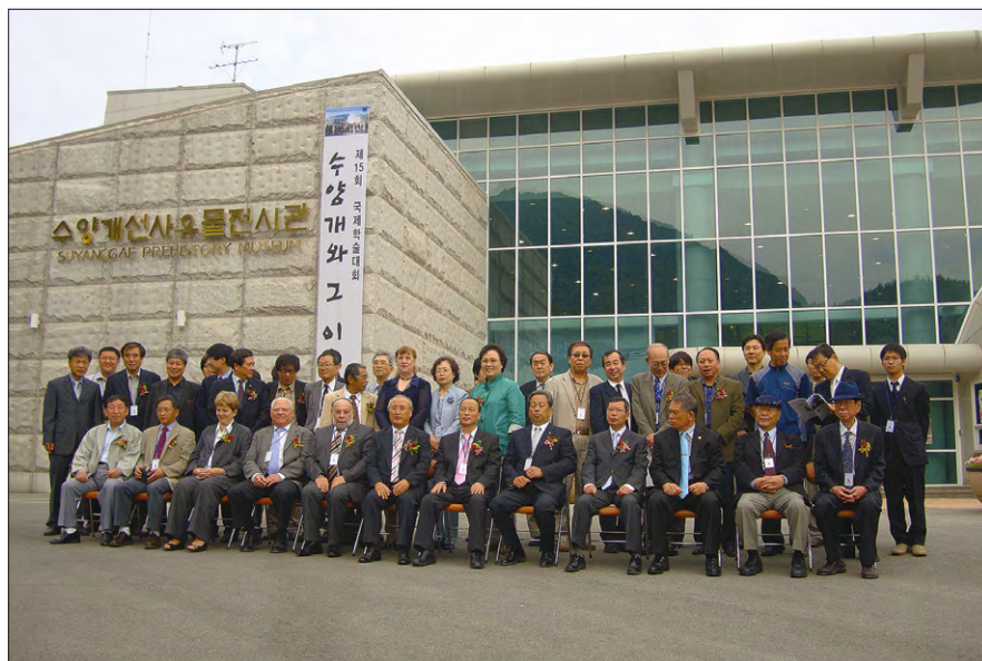
Ryc. 1. Uczestnicy XV konferencji z cyklu „Suyanggae and Her Neighbours” sfotografowani na tle Suyanggae Prehistory Museum.